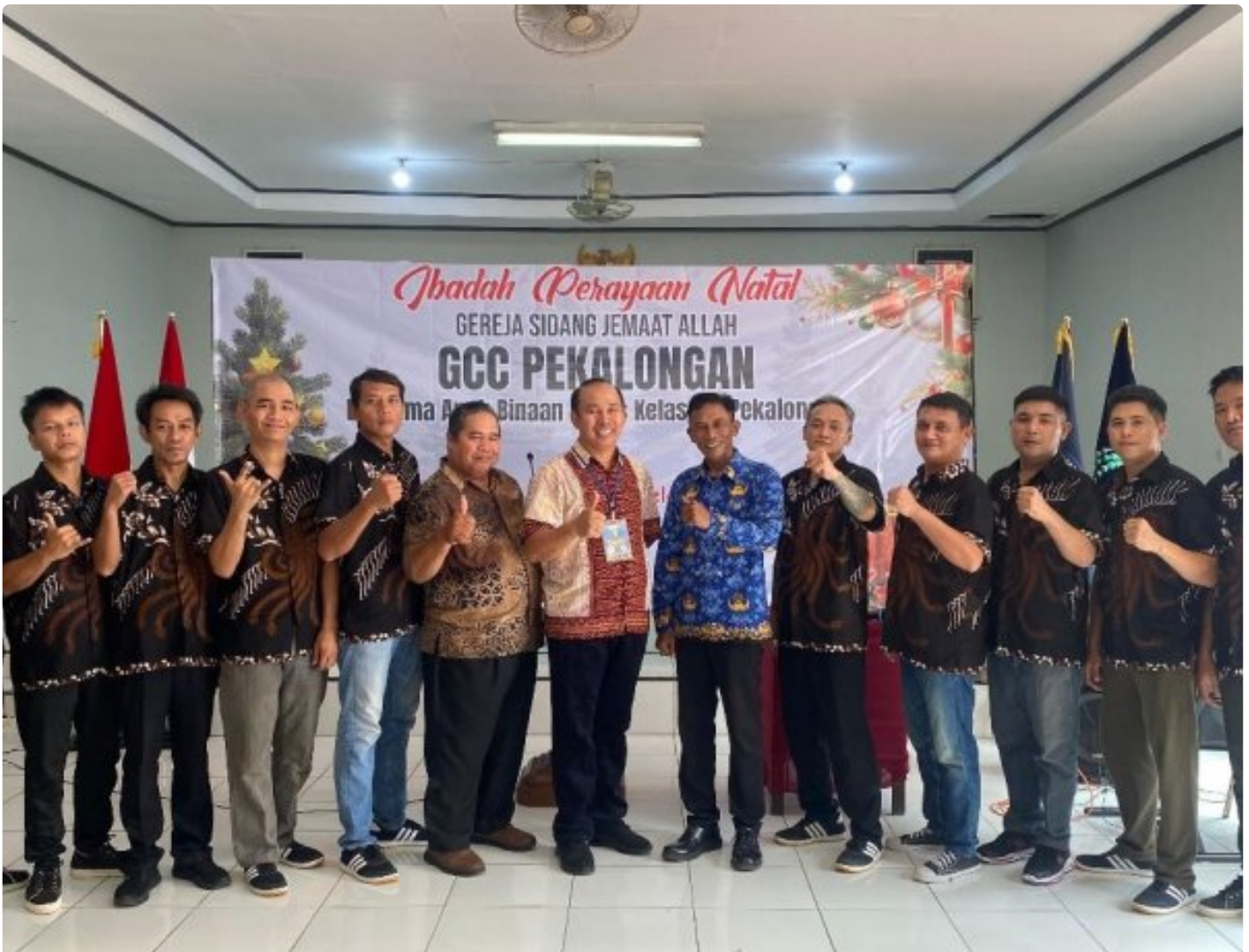
Lapas Pekalongan Gelar Ibadah Perayaan Natal Bersama GSJA GCC Pekalongan

Kota Pekalongan – Lembaga Pemasyarakatan (Lapas) Kelas IIA Pekalongan menyelenggarakan Ibadah Perayaan Natal bersama Gereja Sidang Jemaat Allah (GSJA) GCC Pekalongan, Rabu (17/12), bertempat di Aula Ki Hajar Dewantara Lapas Pekalongan. Kegiatan ini diikuti oleh warga binaan beragama Kristen sebagai bagian dari pembinaan kepribadian dan pemenuhan hak beribadah.